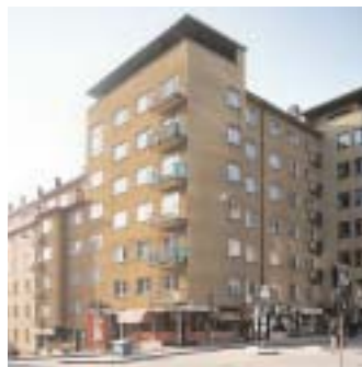
Pontonjärkasern 12 , Hantverkargatan 61, Polhemsgatan 15, 17. I denna tydligt markerade hörnbyggnad från 1935 har Hedvall använt typiska funktionstribut såsom bottenvåningens pelare klädd i rostfritt stål och en takaltan, här med ett skärmtak som ger byggnaden dess särprägel. Foto Ingrid Johansson, 1980-talet.