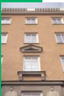
Munklägret 8 , Skillinggränd 5, ett av de många bostadshus Hedvall ritat på Kungsholmen. Det ritades 1927 och har typiska 1920-tals detaljer såsom medaljonger i relief och balustrad framför takvåningen.