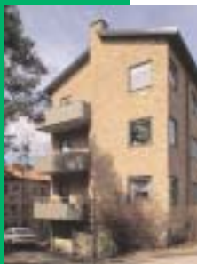
Läsecirkeln 8 , Byggmästarvägen 12–14 i Abrahamshöjden, ritat 1938 av Hedvall, är en del av den mycket enhetliga och välbevarade smälhusbebyggelsen, allt i gult tegel med röda tegeltak. Foto Göran Fredriksson 2001.