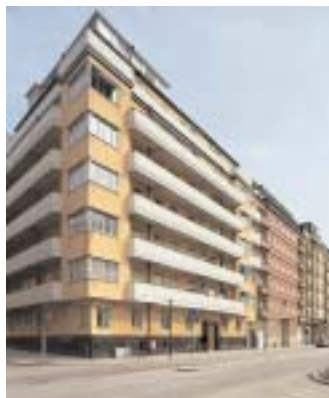
Ett tydligt exempel på Hedvalls parallella användning av renodlade funktionalistiska former i hörnhuset Munklägret 14 , Norr Mälärstrand 20 från 1929 och klassiska former i Munklägret 15 , Norr Mälärstrand 18 ritat 1930.