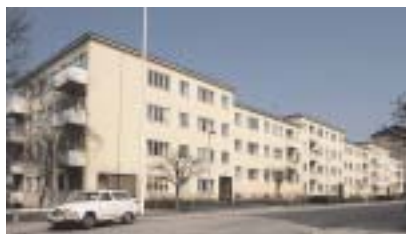
Jerusalem 2 , Levertinsgatan 1–5. På krönet av branten mot Tranebergssund ligger längan från 1931. Trapphusen ligger i husets mitt med takljus. På varje halvplan når man lägenheter, vilket har gett byggnaden varierad takhöjd. Foto Anna Ulfstrand 1985.